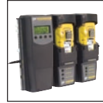
Compatibilité MicroDock II