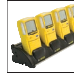
Chargeur multi positions