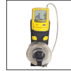
Étui de ceinture